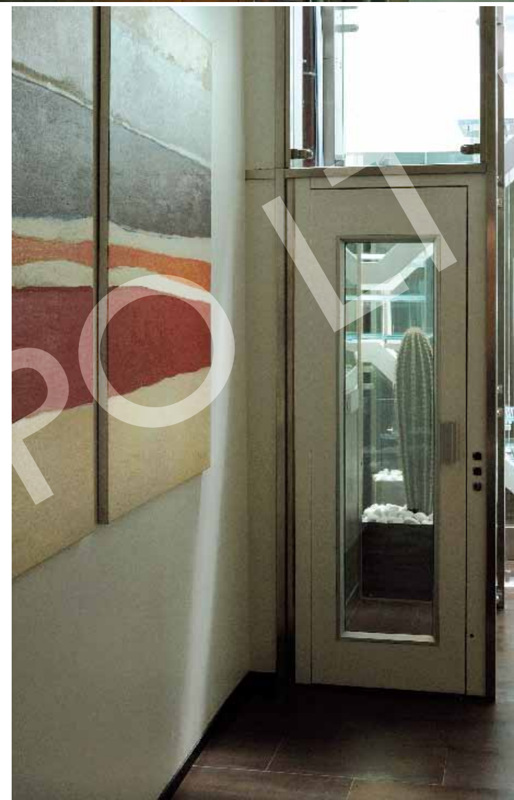
Nella pagina precedente, la cucina è a vista, con blocco cottura centrale e cappa sospesa ad isola; è separata dal soggiorno da una parete trasparente, in cristallo, come la scala e il vano dell'ascensore che collega i tre piani. Nella planimetria, la razionale organizzazione degli spazi. Sopra, la scala di collegamento e il particolare della vetrata sulla terrazza, con vasi in vetroresina grigio-antracite.

bagno. Al piano primo, un salotto con lo spazio Tv; al secondo livello, un grande salone e la cucina con la zona di servizio. All'ultimo piano, una piccola stanza-salotto con vista panoramica. Da quest'ultimo ambiente che, grazie alle ampie vetrate completamente apribili, si apre sul terrazzo, la casa sembra proiettarsi, in un indistinto In & Out, sulla vista spettacolare del colle Aventino. Per collegare, ma anche per sottolineare la verticalità della casa e farne un punto di forza, l'architetto Widmann ha progettato e fatto realizzare sia la scala che l'ascensore in cristallo. La trasparenza del materiale rende possibile, inoltre,