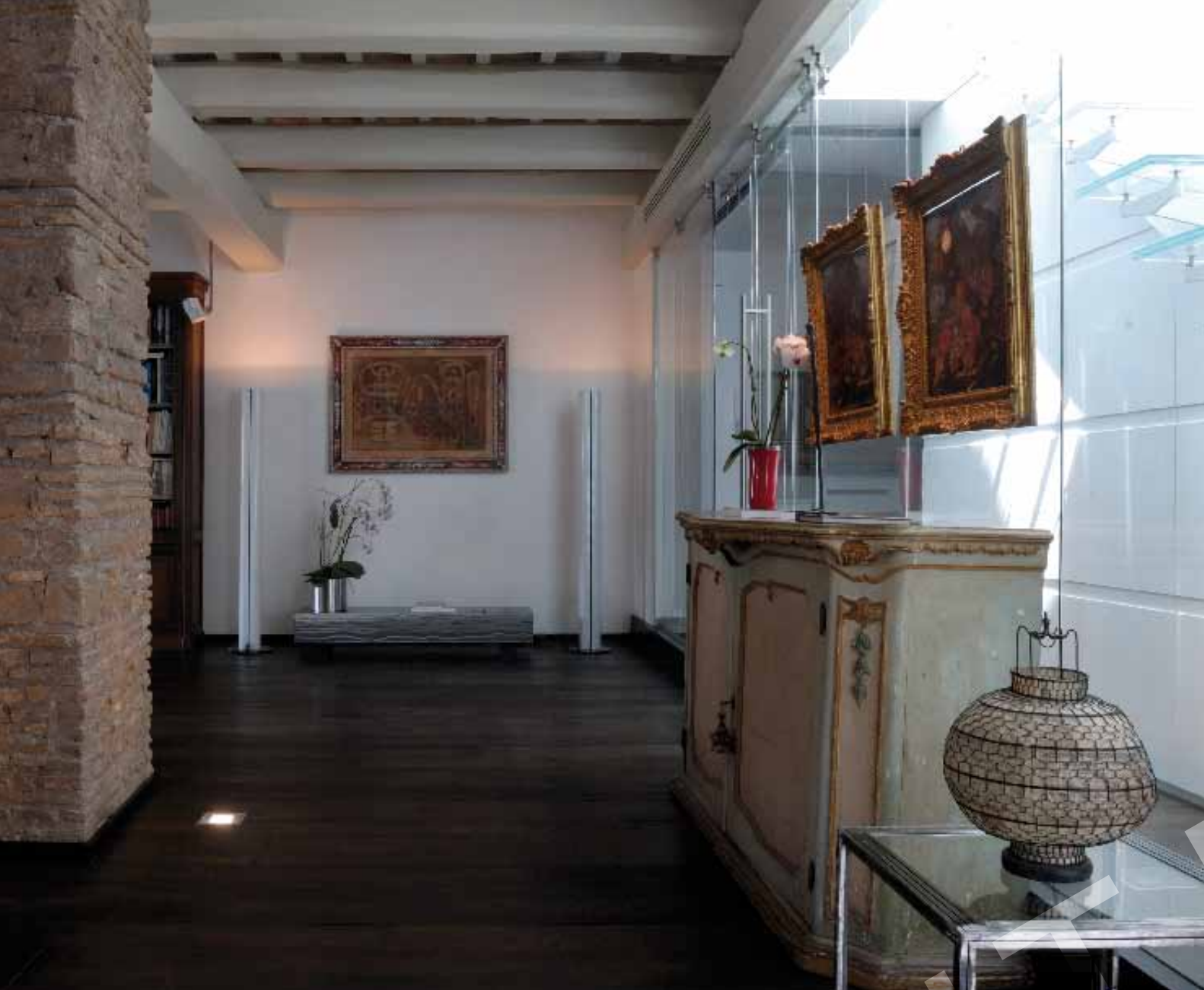
In soggiorno, il riuscito abbinamento tra gli elementi della storia dell'edificio, come le partizioni antiche in mattoncini di fornace, e quelli di nuova realizzazione, come la scala in cristallo. Il soffitto originale a travi in legno è stato riportato a vista e trattato a calce bianca.