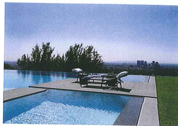
En haut à gauche : la piscine avec en son centre une passerelle en pierre qui paraît flotter au-dessus de l'eau. Ci-dessus : la piscine de nuit, illuminée par un système de LED de couleur. Ci-contre : vue sur Los Angeles.

procurent un sens de la continuité entre l'intérieur et l'extérieur avec les palmiers, les arbres corail, les fougères et les plantes à feuilles persistantes. Au centre du jardin, Widmann a intégré une piscine à débordement avec une passerelle centrale en pierre qui semble flotter au-dessus de l'eau. Elle a su créer un espace de détente avec un grand banc en bois en forme de fer à cheval agrémenté de coussins, qui fait face à une cheminée qui peut être utilisée pour les nuits fraîches. Un ingénieux système domotique permet de modifier la couleur d'ambiance : fuchsia, vert, bleu suivant