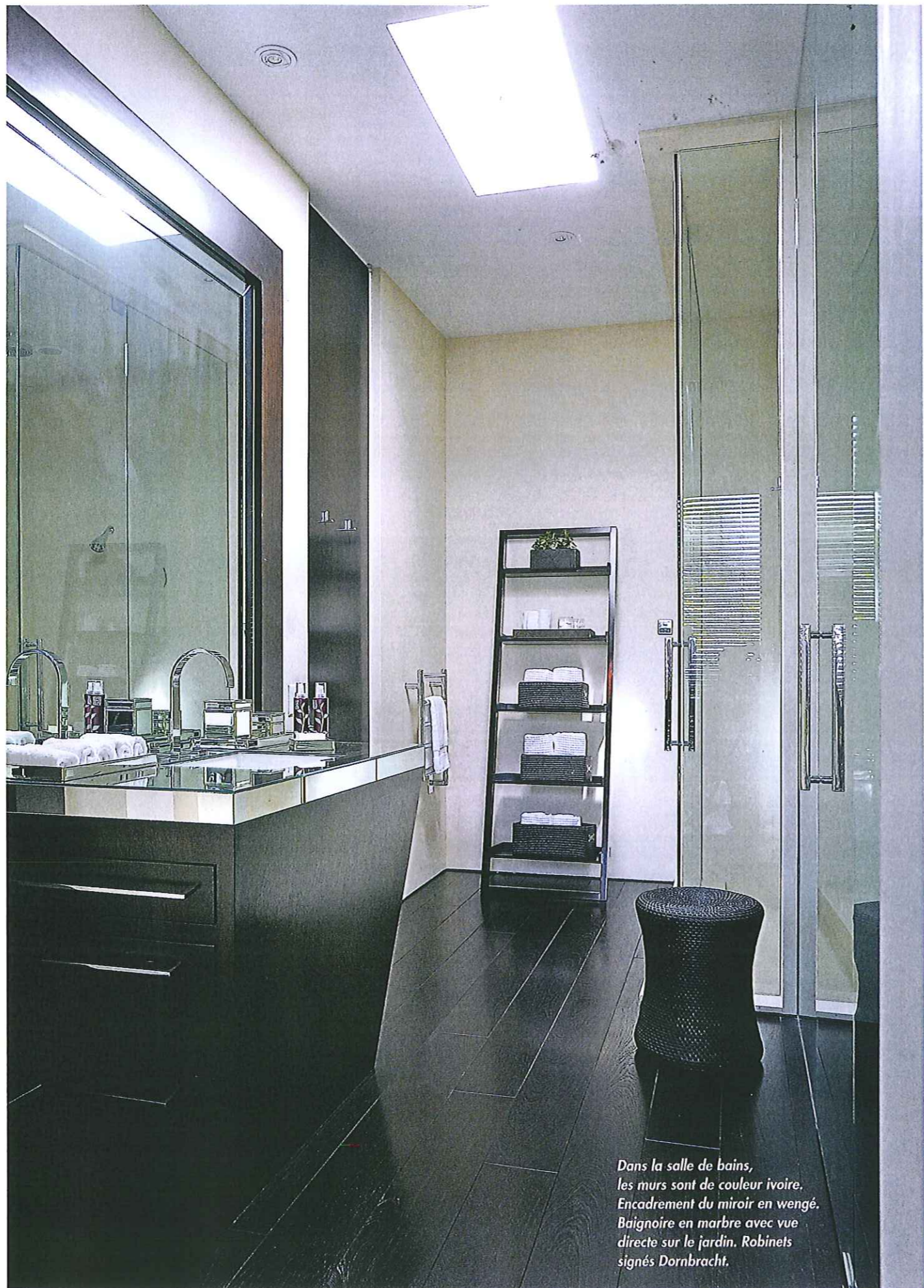
Dans la salle de bains, les murs sont de couleur ivoire. Encadrement du miroir en wengé. Baignoire en marbre avec vue directe sur le jardin. Robinets signés Dornbracht.